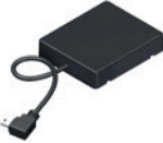
NOVOFERM HOMEMATIC IP MODUL